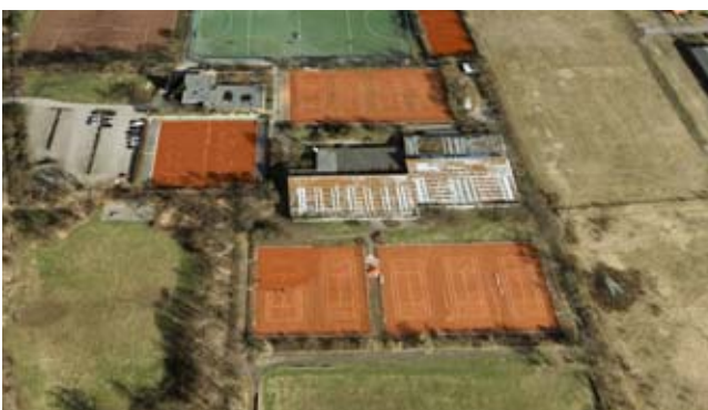
Die MSC-Anlage aus der Luft.

Der MSC befindet sich auch in diesem Jahr in schwierigen Zeiten. Nach Schließung der Hans-Fleitmann-Halle im Sommer 2006 hat sich in den folgenden Monaten herausgestellt, dass die Durchführung der notwendigen Sanierungsmaßnahmen ca. 1,5 Millionen Euro kosten würde. Von dieser Summe müsste der MSC theoretisch 50% aufbringen. Vor kurzem hat der Vorstand allerdings der Stadt mitgeteilt, dass der MSC dazu finanziell nicht in der Lage ist. Es bleibt abzuwarten, wie die Stadt reagieren wird. Da es generell zu wenige Sporthallen in München gibt, ist zu erwarten, dass in dieser Angelegenheit noch nicht das letzte Wort gesprochen ist, zumal der MSC das Gelände von der Stadt gepachtet hat.