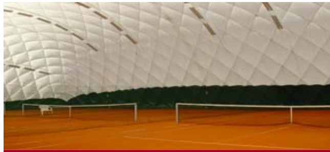
So ähnlich wird die neue „MSC-Arena“ von innen aussehen.

Der Vorstand hat mit diesem Signal auch die Entscheidung verbunden, dass der Beschaffung einer neuen Kunstrasenmatte, die mit ca. 200.000 Euro anzusetzen ist (der MSC müsste wiederum 50% selber tragen), größere Priorität einzuräumen ist. Viele MSC-Hockeyspieler wissen aus schmerzhafter Erfahrung, dass aufgrund von Algen Teile des Platzes nicht mehr ohne Gefahr zu bespielen sind. Die Zielsetzung ist, Mitte 2008 die neue Matte auslegen zu lassen. Voraussetzung hierfür ist aber, dass wir bis zum Frühjahr 2008 genügend Spenden für dieses Projekt einsammeln. Alle Mitglieder erhalten dazu demnächst weitere Informationen in einem gesonderten Anschreiben. Wir dürfen Sie ganz herzlich bitten, sich mit einer Spende an dieser Maßnahme zu beteiligen, da die Sportart „Hockey“ im MSC sonst bald nicht mehr sinnvoll durchgeführt werden kann!