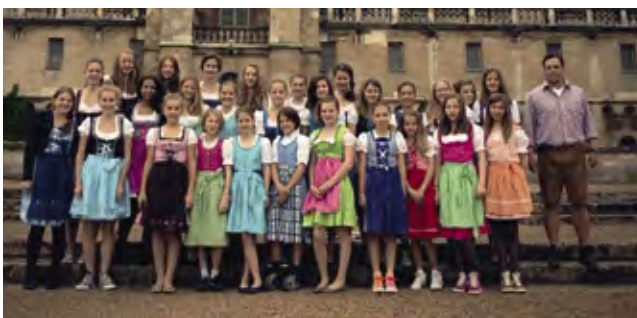
Die Dirndl reisten mit nach Paris: die Mädchen A beim Foto-Shooting

Für das Vorhaben bildete sich ein eigens gegründetes Reiseorganisations-Team, schließlich musste eine Reisegruppe, bestehend aus 60 Personen, an drei Tagen in Paris untergebracht und verköstigt werden. Denn alle wollten mit, Team, Eltern und Geschwister. Die Anreise erfolgte per Bus: Start vom Club direkt nach Paris.