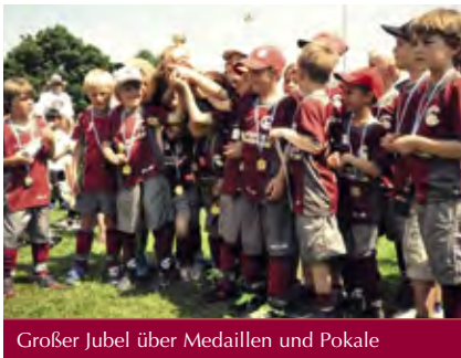
Großer Jubel über Medaillen und Pokale

In diesem Jahr hat sich das „Jappa“ dem Motto „Mit dem Sport Gutes tun“ verschrieben. Für jedes geschossene Tor sollten 5,- Euro an „Sternstunden“, die Benefizaktion des Bayerischen Rundfunks, gespendet werden. So war jeder erzielte Treffer nicht nur sportlich ein Erfolg.