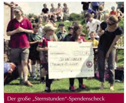
Der große „Sternstunden“-Spendenscheck