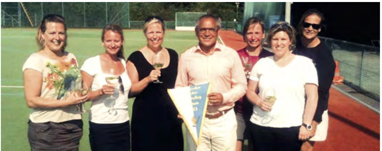
Den Meisterwimpel bekamen die 2. Damen von Felix Magath überreicht