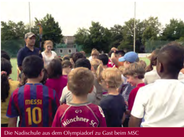
Die Nadischule aus dem Olympiadorf zu Gast beim MSC

Erfreulich aus MSC-Sicht: der U10-Bereich wächst und wächst. Hier zeigen sich die ersten Erfolge einer groß angelegten Schnupperaktion mit den Münchner Grundschulen. Etwa 700 Kinder besuchten vor den Sommerferien den Club und wurden so erstmals an den Hockeysport herangeführt. Eine gute und notwendige Maßnahme, die auch im kommenden Jahr wieder stattfinden wird. Denn nur die frühe Begeisterung fürs Hockey und eine große Anzahl an Kindern sichert die Zukunft für unseren Sport, für den wir immer weiter werben müssen. Dies ist wichtig für den Leistungssport, wie auch für den Breitensport.