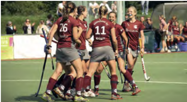
So schön kann Jubel sein, hoffentlich auch in der neuen Saison

Deswegen werden die 1. Damen des MSC keine Reden schwingen, dass man aus der Enttäuschung neue Kraft schöpft und versucht, diesen „Flow“ mit Beginn der Vorbereitung wieder aufzunehmen.