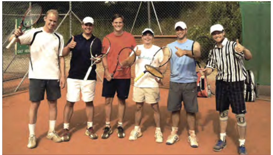
Die Herren 30 II spielten sich souverän an die Tabellenspitze

Die etwas reiferen Herren 40 II machten es da schon spannender. Nach zwei wichtigen Siegen gegen Kirchheim und Lohhof, folgte gegen Neuperlach-Kail eine unerwartete Niederlage. Doch auch Neuperlach-Kail musste noch Punkte abgeben und so blieb es in dieser sehr ausgeglichenen Staffel spannend bis zum Schluss. Der entschei-