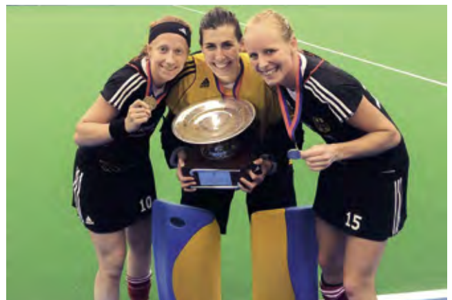
Die Golden Girls Nina, Kim und Hannah mit den EM-Trophäen