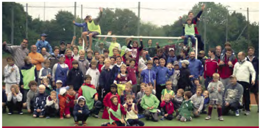
Der MSC-Jungs-Tag war trotz Regen eine Riesengaudi für über 100 Hockeyspieler

Auch wenn die Bundesliga-Damen im Gegenzug erst den zweiten Mädels-Tag organisierten, einen Vorteil hat diese Veranstaltung: es scheint stets die Sonne! Die Zahl der Teilnehmerinnen steigt kontinuierlich an – am 1. Mai waren diesmal schon 40 weibliche Nachwuchsstars mit